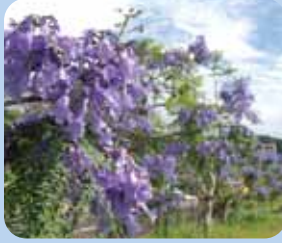
ジャカランダの花

ジャカランダが小浜温泉に植えられたのは昭和40年代、エチオピア暮らしの男性の「島原半島全体にジャカランダの花を咲かせて!」との願いから始まりました。亜熱帯性の植物であるジャカランダは湯けむりの町・小浜温泉で大樹に育ち、現在では雨の季節の風物詩となりました。紫の花びらが高貴な雰囲気とほのかな香りで魅了し、訪れる人々の心を癒してくれます。あなたも紫の花に癒されてみませんか?